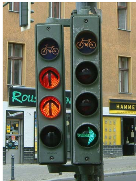
Sygnalizacja kierunkowa dla rowerów w Berlinie.

Polskie prawo nie dopuszcza też wariantu holenderskiego, gdy na skrzyżowanie wpuszcza się tylko rowerzystów, ale ze wszystkich kierunków, nawet kolizyjnych. Rozwiązanie takie, mimo iż nawet w Holandii nie jest popularne, mogłoby z powodzeniem być stosowane w przeprowadzaniu ruchu rowerowego przez przewężenia, np. gdy jezdnie i obustronne drogi rowerowe zbiegają się do tunelu, gdzie jest tylko jedna jezdnia – można byłoby wprowadzić fazę dla rowerzystów jadących w obie strony.