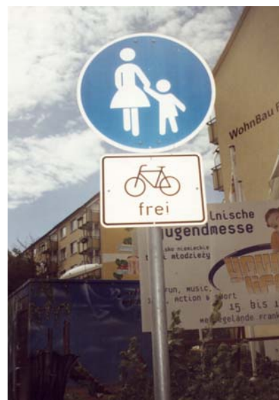
Niemiecki odpowiednik znaku C-16 z tabliczką dopuszczającą ruch rowerowy. Frankfurt nad Odrą.

Nie ulega wątpliwości, iż treść przytoczonych postanowień stanowi przejaw nadmiernej, źle pojętej troski o bezpieczeństwo rowerzystów, która przynieść może skutki odwrotne od oczekiwanych. Sądzić należy, iż w przypadku wyznaczania na trasach dróg rowerowych przejść dla pieszych większość rowerzystów nie będzie stosować się do uciążliwego obowiązku przeprowadzania rowerów po pasach. W konsekwencji to właśnie rowerzyści, a nie